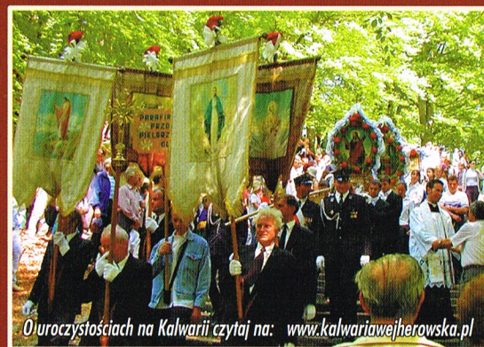
Ouroczystościach na Kalwarii czytaj na: www.kalwariawejherowska.pl